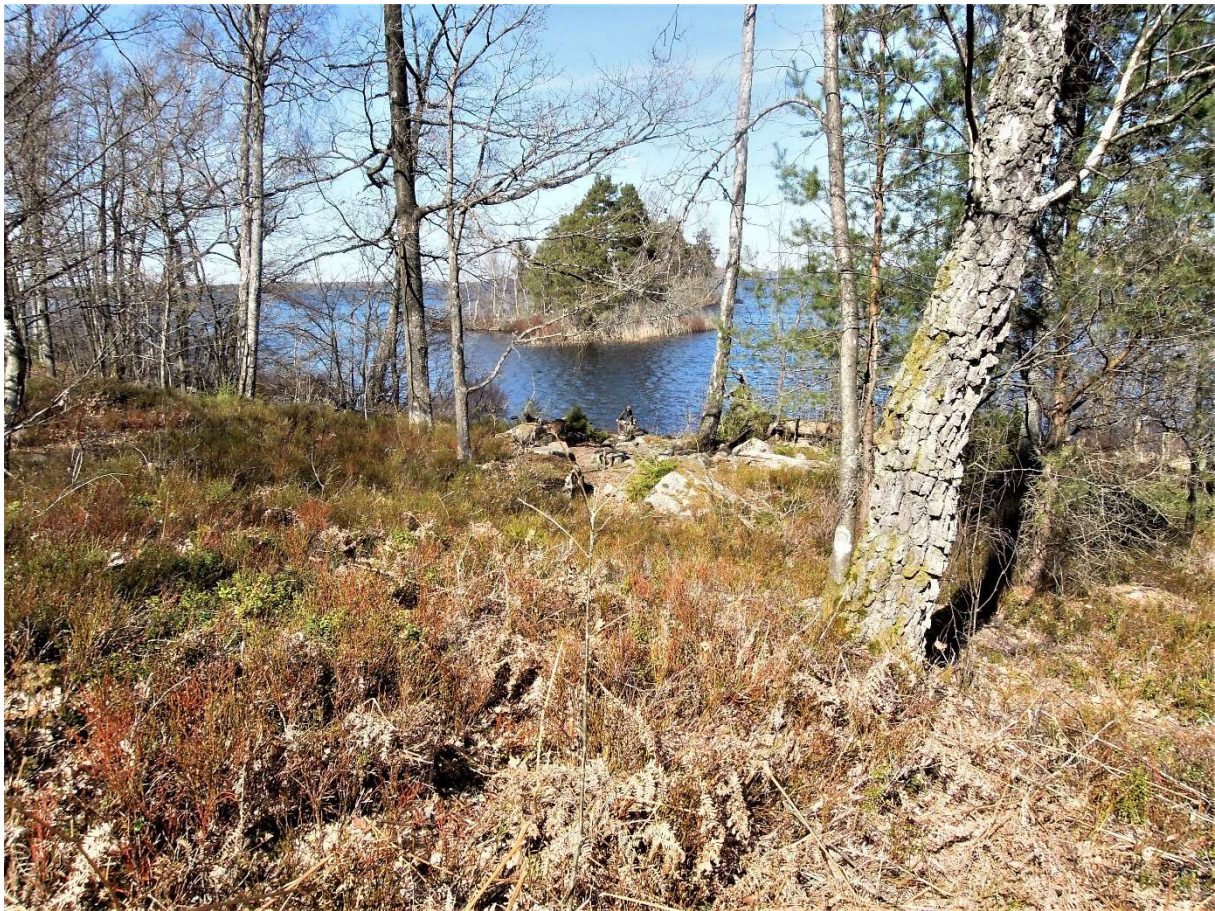
Det registrerade området ligger i sin helhet bortom den kraftiga björken. Foto mot N.