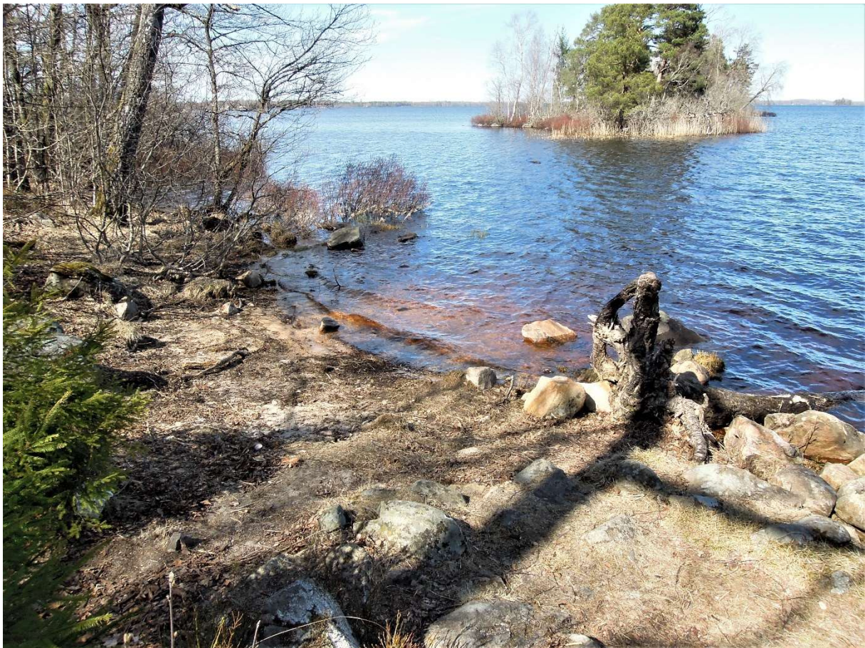
Sjöbotten innan sjösänkningen 1852.