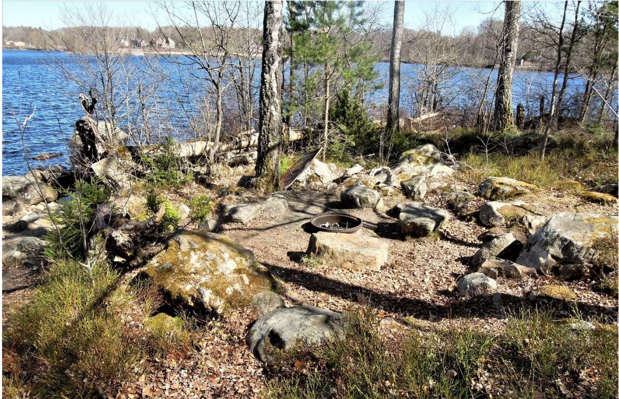
Grillningsplatsen inom området.