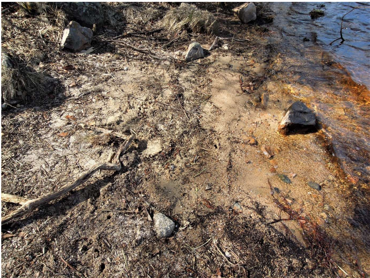
Sjöbotten med grus/sand.