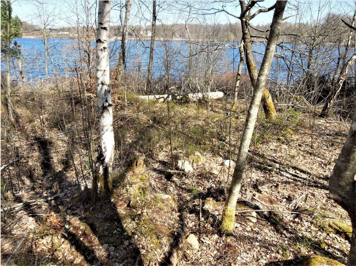
Alternativt läge för angöringsplats på Näset. Den gamla sågverkstomten i bakgrunden. Foto mot NÖ.

Osby 2022-04-25 Sune Jönsson Kulturmark Sune Jönsson